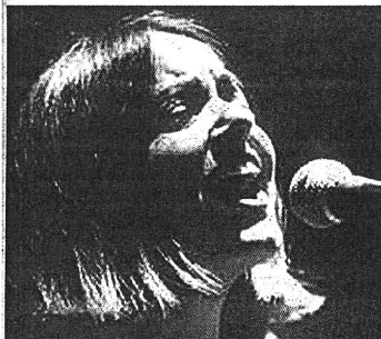
La ruvida voce di Nada è protagonista stasera a Casalpusterlengo