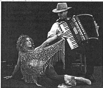
Due artisti dell'Alexian Group, il quartetto abruzzese oggi al Teatro Pax

Davide Van De Sfroos suona sull'Isola d'Elba note dolci in acque salate