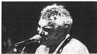
Massimo Bubola canta Tre Rose , disco prodotto da Fabrizio De Andrè